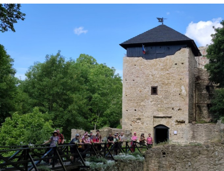
Před hradem Lukov

Další den bylo pondělí a po snídani následoval již jen odjezd k domovům.