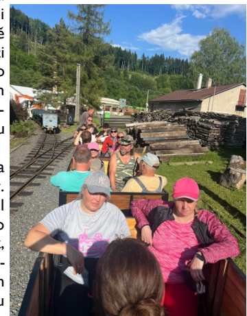
Na Rajnochovické lesní železnici

Tento Informační list - občasník pro vnitřní potřebu vydavatele vydala: Federace vlakových čtí - prezidium P.O. BOX 1431 111 21 Praha 1