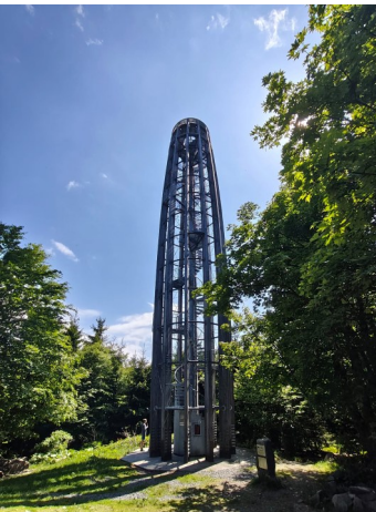
Rozhledna na Kelčském Javorníku

dobrého moku a přípravu na zasloužený noční odpočinek.