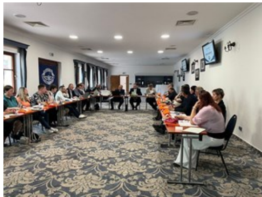
Delegáti při jednání XIII. Valné hromady FVČ